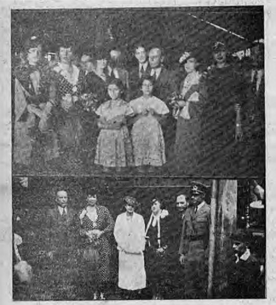
Recoge el grabado dos aspectos de la misión belga que se tributó en la estación del Atlántico a la embajada costarricense que asistirá a la toma de posesión del presidente electo de Panamá

Misión belga viene a Costa... (VIENE DE LA PÁGINA UNO) La misión a que nos referimos cuya fecha de salida de Bruselas no se ha fijado todavía, vendrá aquí a estudiar las condiciones de nuestro medio para la colonización de artículos belgas y a estudiar también las posibilidades de llevar artículos belgas costarricenses para aquel mercado. Tanto la secretaría de hacienda como la cámara de comercio han ofrecido su cooperación para el éxito de la misión que se propone llevar a cabo la oficina belga-inter nacional y que será, sin duda, de grandes beneficios para nuestro país.