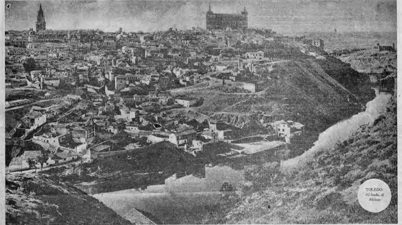
TOLEDO. Al fondo, el Alcázar

LOS REBELDES SIGUEN LA TACTICA EXACTA CON QUE WELLINGTON DERROTO A LOS MARISCALES DE NAPOLEON Y TOMO A MADRID Una apasionante relación del asalto desesperado de los gobiernistas UNA DE LAS MAS SENSACIONALES NARRACIONES DEL HEROISMO DE LOS CADETES SITIADOS QUE AYER QUEDARON RESCATADOS