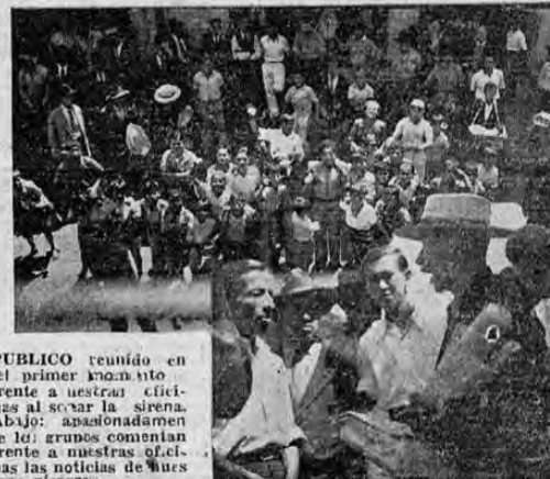
PUBLICO reunido en el primer momento frente a nuestras oficinas al serarle la sirena. Abajo: apasionadamente le los grupos comentan las noticias de estas plazas.

DOCE MIL EJEMPLARES FUERON AYER TIRADOS POR NUESTRO COLEGA QUE LLEVO LA NOTICIA Y LOS DETALLES DEL RESCATE DEL ALCAZAR